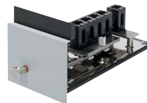
Держатель на 4 кюветы с ручной сменой образцов